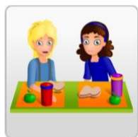
Pauze en lunch