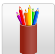
Handvaardigheid / tekenen / muziek