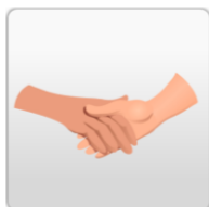
Sociaal- emotionele ontwikkeling